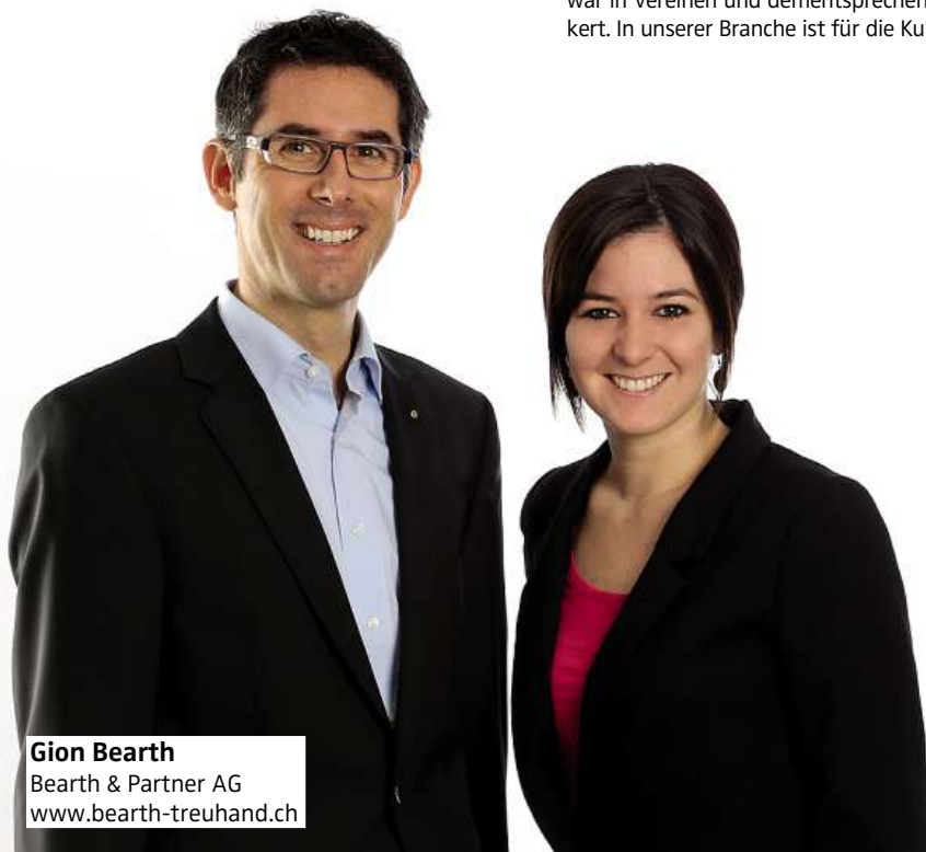
Gion Bearth Bearth & Partner AG www.bearth-treuhand.ch

Interessierte sind eingeladen, an einem Morgentreffen unverbindlich teilzunehmen. Wir freuen uns auf Ihre Voranmeldung bei einem der Vereinsmitglieder.